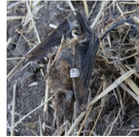
Toter beringter Abendsegler unter einer Windkraftanlage im Windpark Fischbeck (Sachsen-Anhalt).

In den nächsten Tagen und Wochen sollten deshalb vermehrt Kastenkontrollen, Netzfänge und Schlagopfersuchen durchgeführt werden, um Ring-Fernwiederfunde zu generieren!