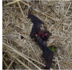
Tote Flughäute unter einer Windkraftanlage im Windpark bei Laukžemė (Litauen).

Der herbstliche Zug bescherte allerdings auch schon die ersten Schlagopfer an Windkraftanlagen, wie auf den Fotos rechts ersichtlich. In einem Windpark in Litauen wurden beispielsweise bei einer einzigen sporadischen Begehung bereits 7 tote Flughäute gefunden. In Sachsen-Anhalt wurde sogar ein beringter Abendsegler festgestellt. Die Tiere sterben laut IZW durch direkte Kollisionen und durch die enormen Druckschwankungen, die durch die drehenden Rotorblätter entstehen (Barotrauma).