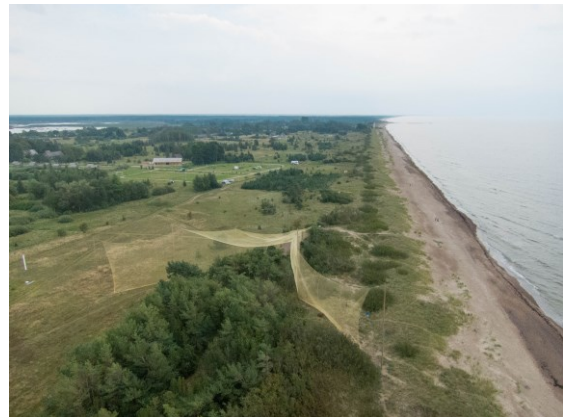
Heligoland trap in Pape (Latvia).

So wurden in der Forschungsstation in Pape / Lettland bereits mehr als 5.000 Fledermäuse beringt, die in einer Trichterfalle gefangen wurden, welche im Rahmen einer Kooperation zwischen dem Leibniz-Institut für Zoo- und Wildtierforschung (IZW) in Berlin und der Lettischen Universität in Riga betrieben wird. Laut Prof. Dr. Gunars Petersons (Agrarwirtschaftliche Universität in Jelgava) wurden seit dem 19ten August, dem Beginn der diesjährigen Migration an der lettischen Ostseeküste, mehr als 4.000 beringte Rauhaufledermäuse ( Pipistrellus nathusii ) wieder freigelassen. Hinzu kommen zahlreiche Mückenfledermäuse ( Pipistrellus pygmaeus ), Zweifarbfledermäuse ( Vespertilio murinus ) und Abendsegler ( Nyctalus noctula ). Die diesjährigen Ergebnisse stellen einen neuen Rekord für die Forschungsstation in Pape auf, in der seit den 1960er Jahren Fledermausforschung betrieben wird. Die anwesenden Fledermausforscher aus Lettland, Deutschland und den Niederlanden staunten über das einzigartige Naturschauspiel, wie tausende Fledermäuse im küstennahen Zugkorridor durchziehen.